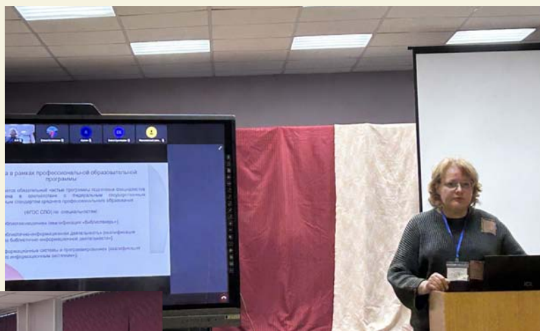
Заместитель директора по библиотечной работе СПб ССДБ им. А.С. Пушкина

В течение двух дней было заслушано 12 докладов и представлено 4 стендовых доклада коллег из Москвы, Санкт-Петербурга, Вологды, Казани, Могилева (Беларусь).