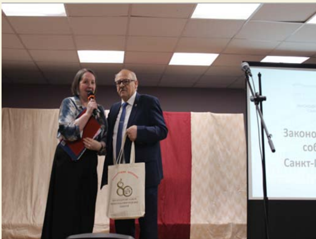
Председатель постоянной комиссии по социальной политике и здравоохранению, депутат Законодательного Собрания Санкт-Петербурга Александр Николаевич Ржаненков

С приветственным словом от имени Председателя Законодательного Собрания Санкт-Петербурга А. Н. Бельского и от себя лично выступил Председатель постоянной комиссии по социальной политике и здравоохранению, депутат Законодательного Собрания Санкт-Петербурга А.Н. Ржаненков.