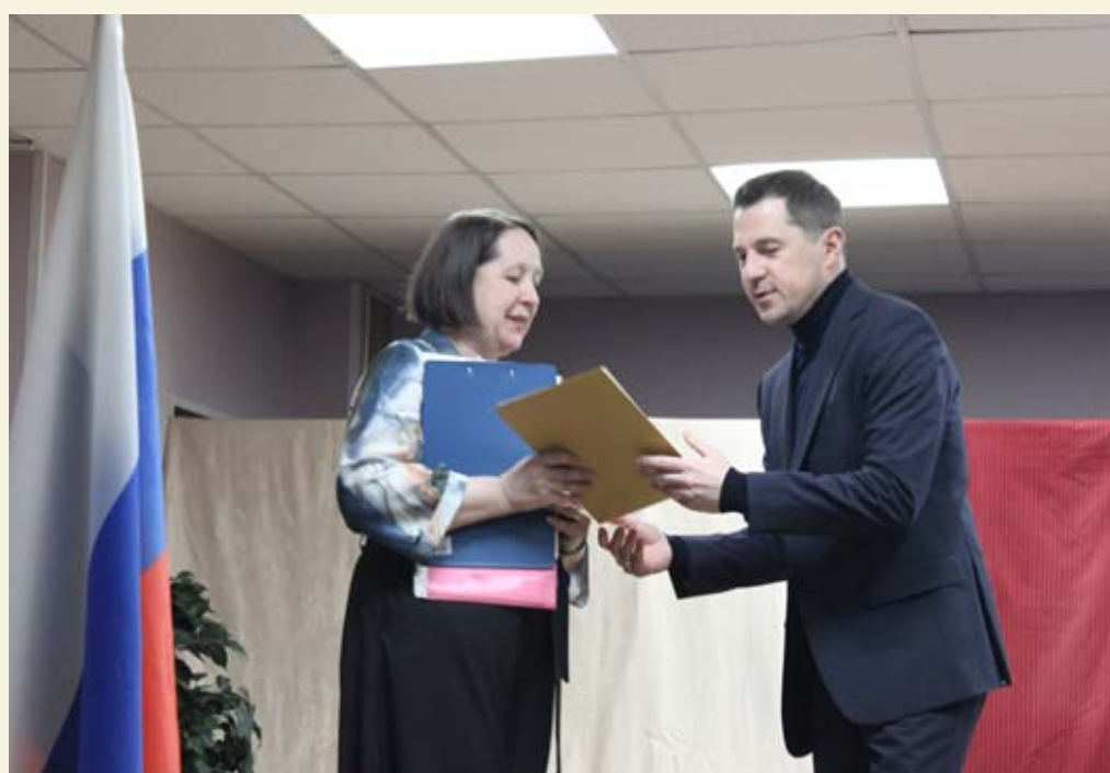
Председатель Комитета по культуре Санкт-Петербурга Федор Дмитриевич Болтин