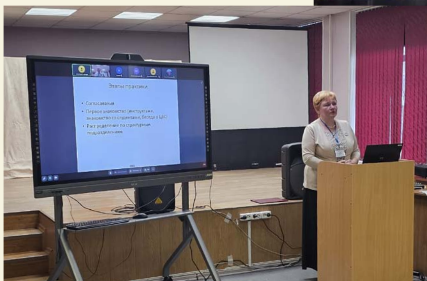
Заведующая отделом БИР ЦБС Калининского района